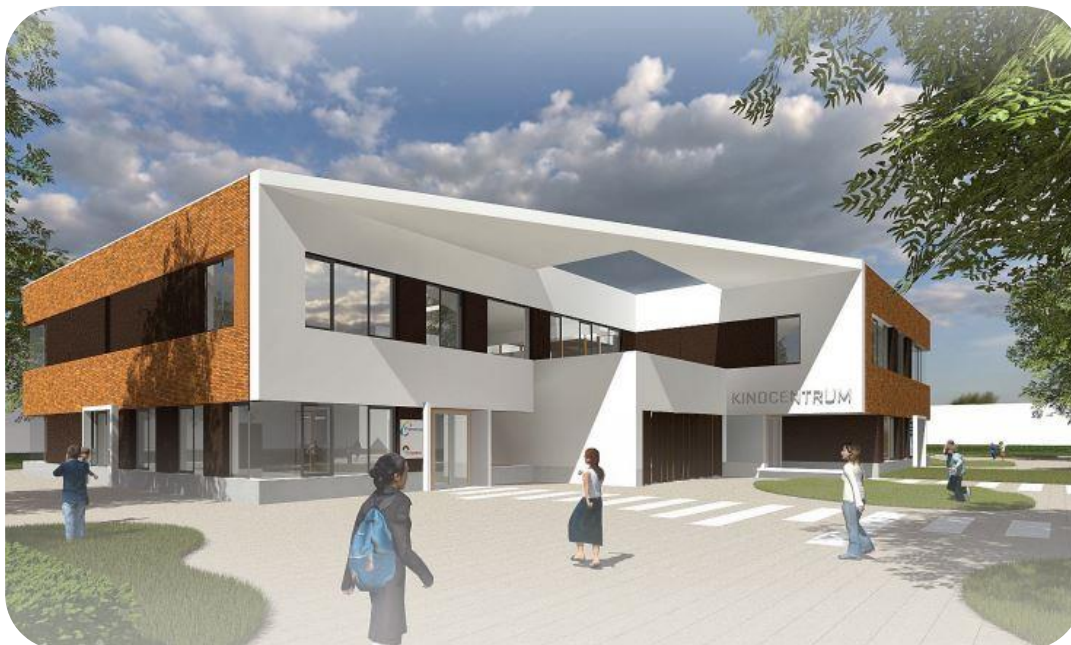
Figuur 1: Ontwerp - Kristinsson Architecten.

Het Definitief Ontwerp is inmiddels afgerond en goedgekeurd door de Stuurgroep van het Kindcentrum.